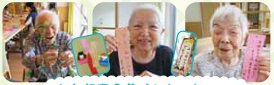
七夕行事食美味しかったーっ!!