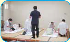
3年ぶりです！ 気持ちいいマッサージで リフレッシュ ありがとうございました。