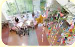
飾り作りは 1ヶ月かかりました。