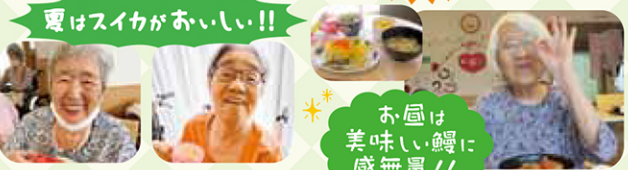
夏はスイカがおいしい!!