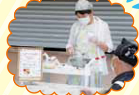
作業の様子をじっと 見られているので スタッフも緊張！