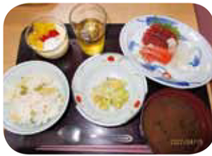
4/15 ふれ愛デイ 誕生日会