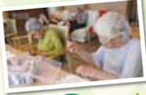
誕生日は みんなで お祝い♪