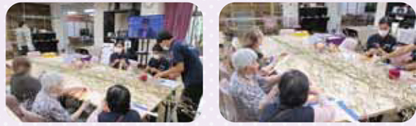
★ みんなでセタの飾りつけをしました ★