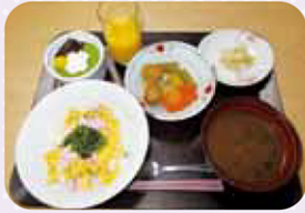
ちらし寿司をいただきました