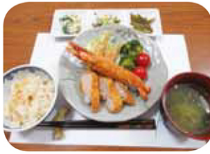
4/25 ケアハウス 食事会