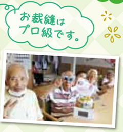
お裁縫は プロ級です。