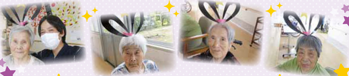
みなさんの願いごとが叶いますように