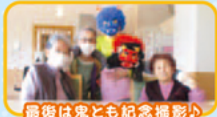
最後は鬼とも記念撮影♪