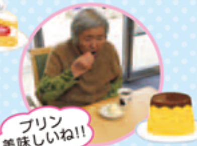
プリン 美味しいね!!