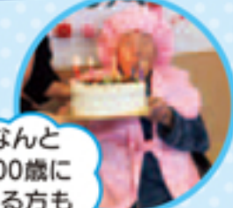
なんと 100歳に なる方も