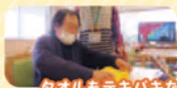
タオルもテキパキたんで下さっています