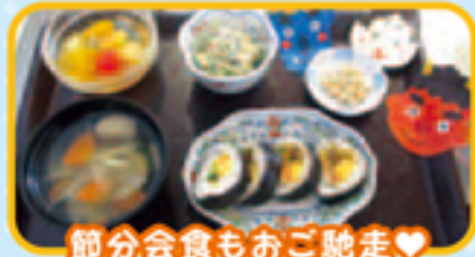
節分会食もおご馳走♡