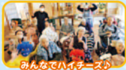
みんなでハイチース♪