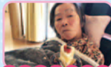
ケーキ美味しかったよ♡