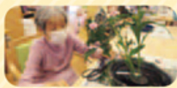
毎月の手芸教室や生け花も素敵に仕上がっています