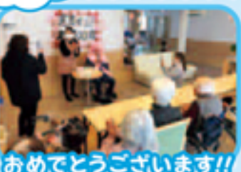
おめでとうございます!!