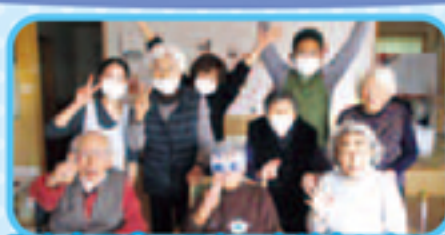
みんなで食べるケーキはおいしい!!