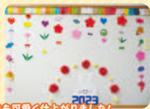
壁画飾りも可愛く仕上がりました!